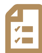
REGLAMENTO DEL PAAI

Te sugerimos leerlos detenidamente ya que en ellos encontrarás la información necesaria para concluir satisfactoriamente el PAAI