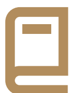
MANUAL DE USUARIO

El acceso a la plataforma comenzará el 25 de abril a partir de las 10 horas (tiempo del centro de México), contarás con 24 horas para revisar los documentos publicados en la sección de presentación