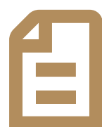
PLAN DE TRABAJO